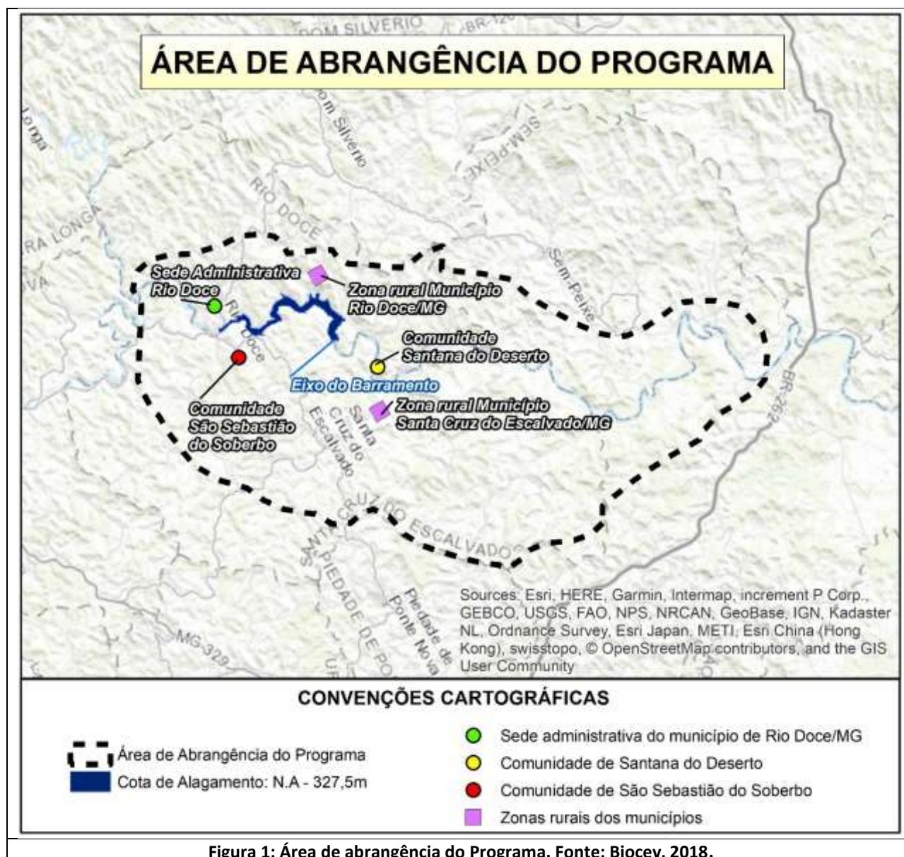
Figura 1: Área de abrangência do Programa.