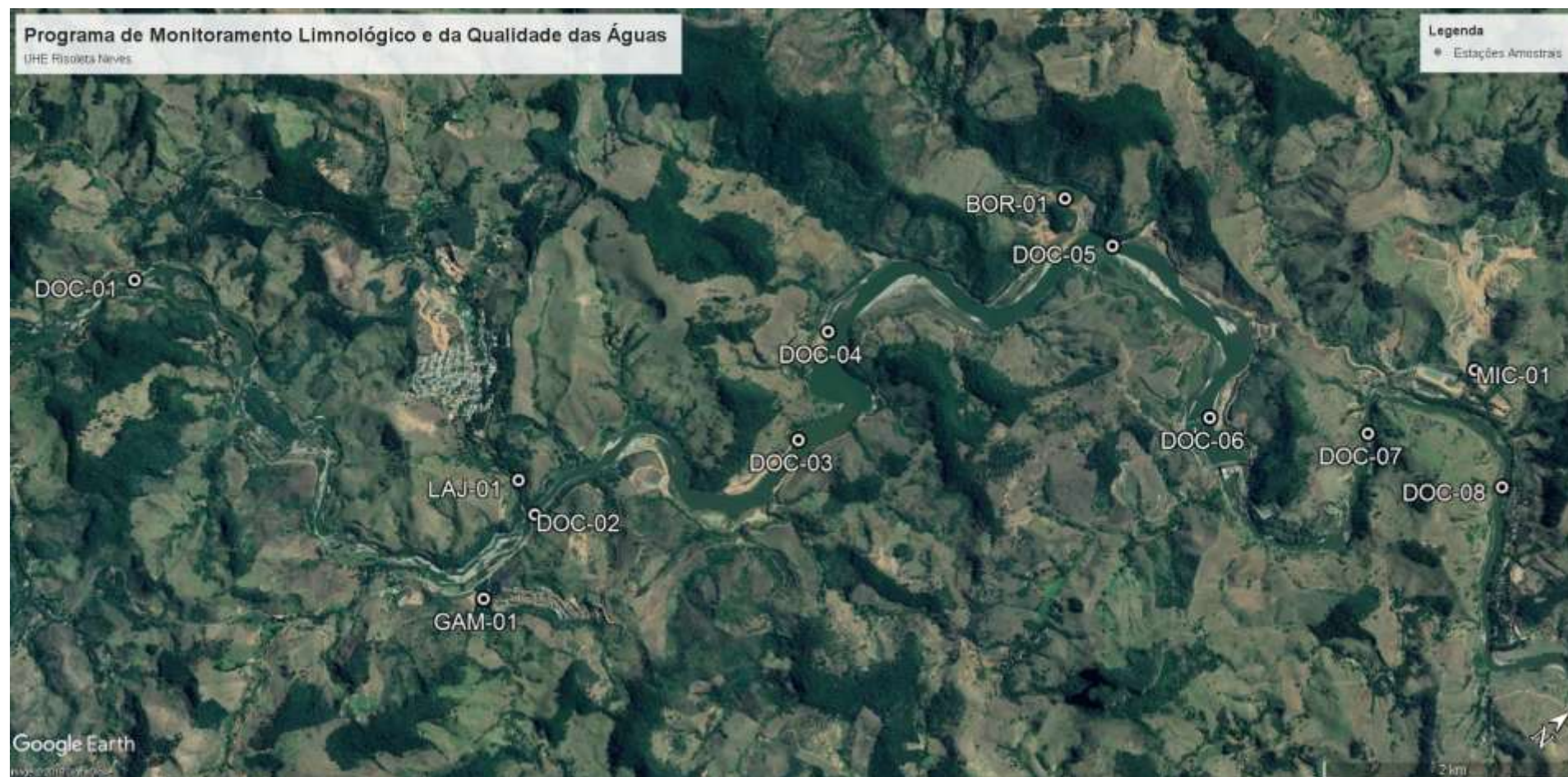
Figura 4: Localização geográfica das estações de monitoramento do Programa de Monitoramento Limnológico e da Qualidade das Águas da UHE Risoleta Neves.